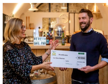
Les gens heureux