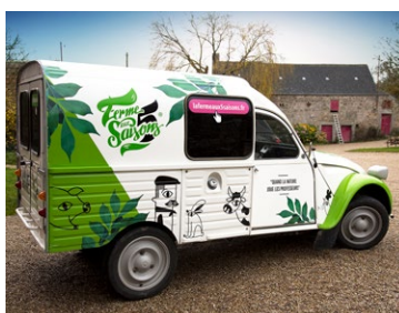
Ferme aux saisons